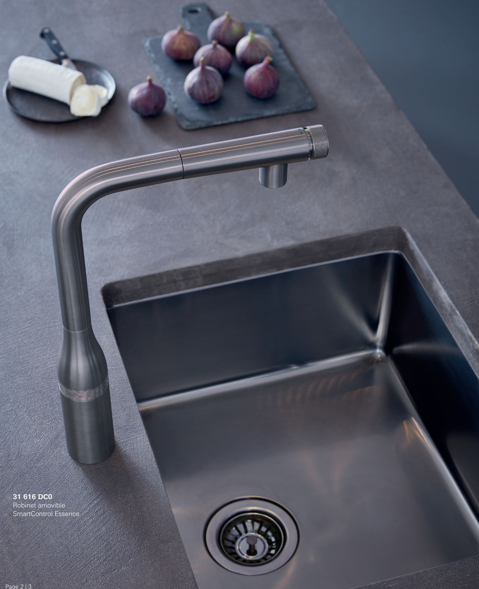
31 616 DC0 Robinet amovible SmartControl Essence