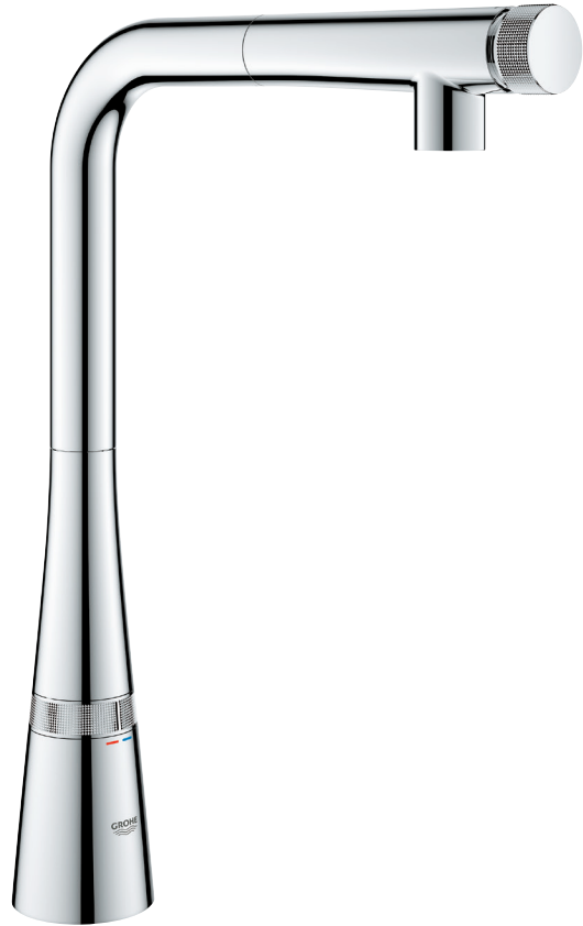
● ● 31 559 002/DC2 Robinet amovible SmartControl Ladylux L2