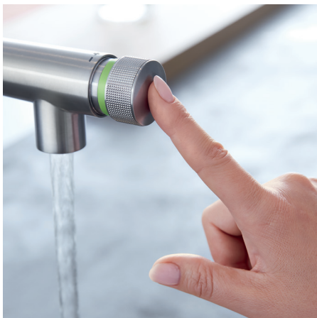
Bouton poussoir pour démarrer ou interrompre le débit d'eau

Socle magnétique – Rétraction facile et rangement sécuritaire de la tête de pulvérisation amovible