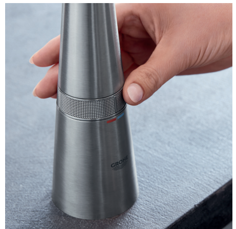
Faites tourner la molette à la base du robinet dans un sens ou dans l'autre pour régler la température de l'eau