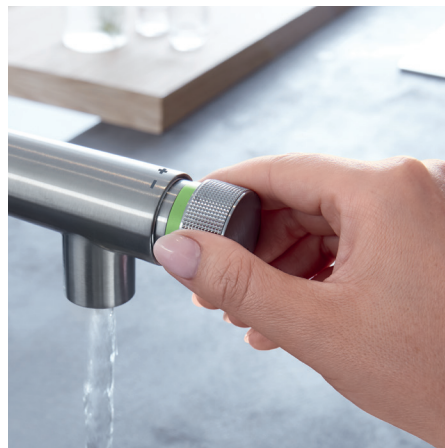
Molette pour le réglage du volume d'eau, d'un léger filet à un débit puissant