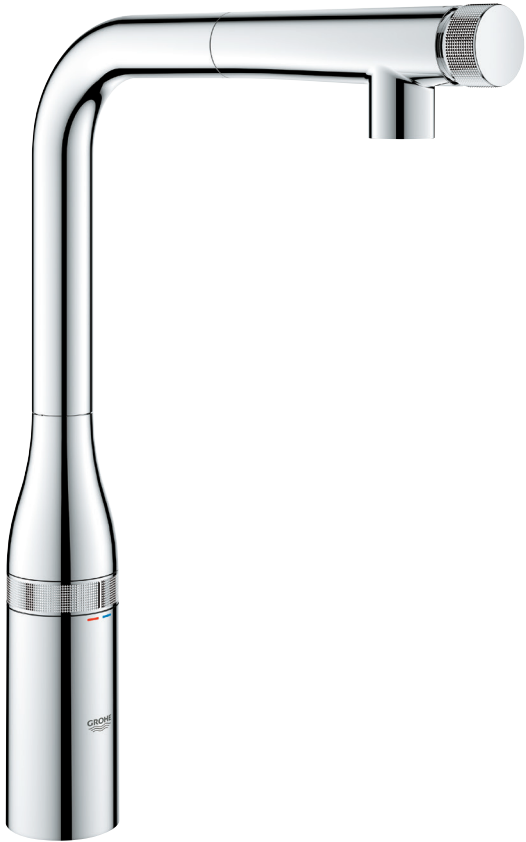
● ● 31 616 000/DC0 Robinet amovible SmartControl Essence