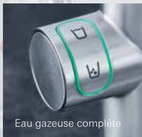
Eau gazeuse complète