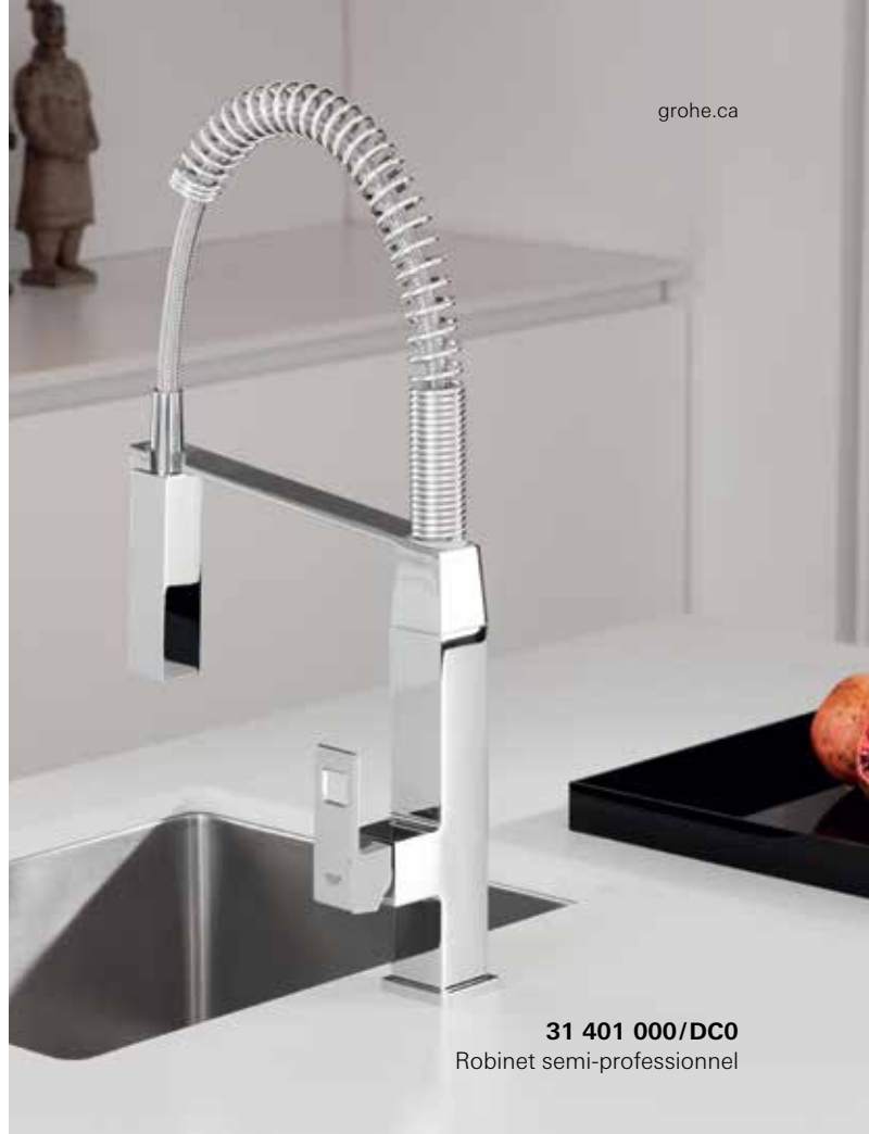
31 401 000/DC0 Robinet semi-professionnel