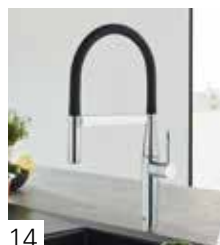
GROHE ESSENCE SEMI-PRO