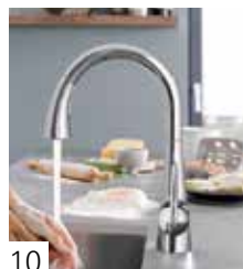
GROHE LADYLUX 3 CAFÉ COMMANDÉ AU PIED