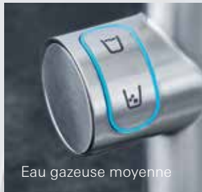
Eau gazeuse moyenne