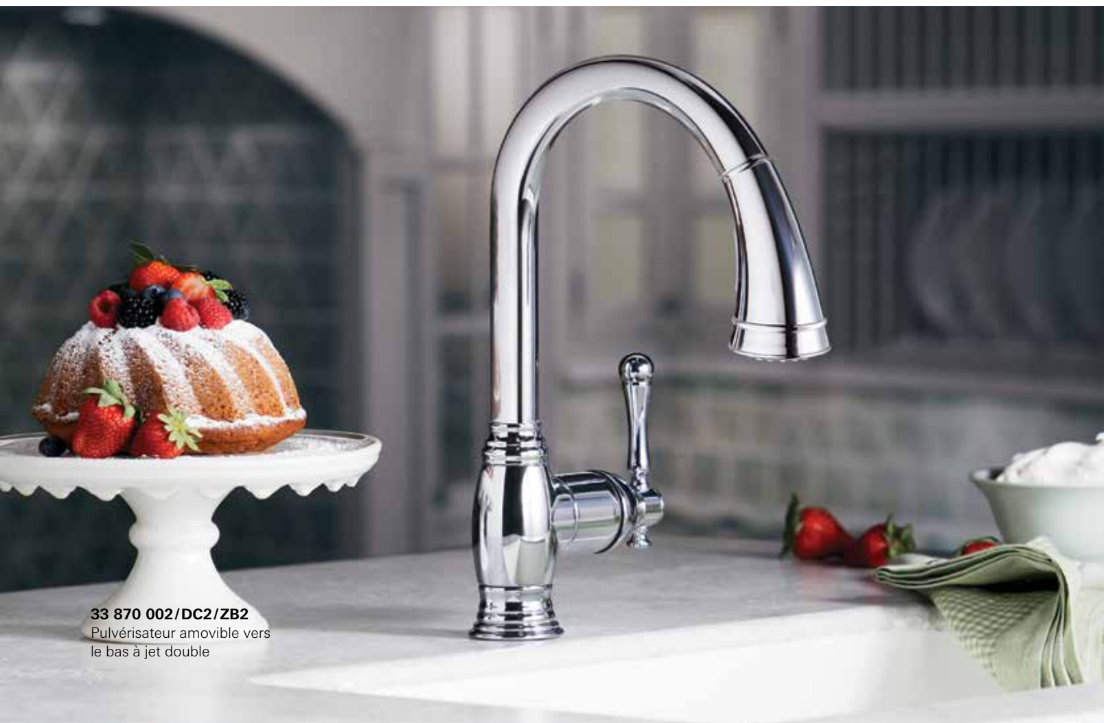
33 870 002/DC2/ZB2 Pulvérisateur amovible vers le bas à jet double

Pour les personnes qui s'entourent du confort de la simplicité d'époque, le robinet Bridgeford complète à merveille une cuisine de style traditionnel sans compromettre la performance du 21 e siècle. Le souci du détail traditionnel est perfectionné sur le robinet de tablier ou de bar Bridgeford, tandis que le pulvérisateur amovible vers le bas à jet double apporte une fonctionnalité moderne à une cuisine de style victorien. Les robinets de cuisine Bridgeford offrent la technologie GROHE SilkMove MD pour un réglage facile de l'eau et sont offerts en fini bronze huilé durable GROHE, en chrome GROHE StarLight MD éclatant et en SuperSteel InfinityFinish MC attrayant.