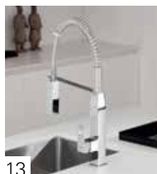
GROHE EUROCUBE MD