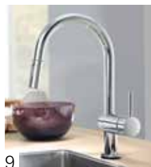
GROHE MINTA MD TACTILE