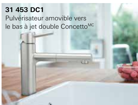
31 453 DC1 Pulvérisateur amovible vers le bas à jet double Concetto MC