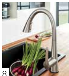
GROHE LADYLUX 3 CAFÉ TACTILE