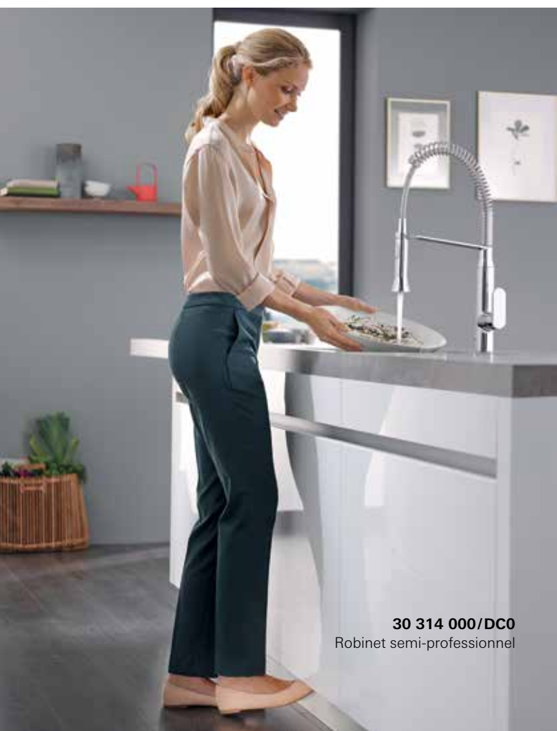
30 314 000/DC0 Robinet semi-professionnel

Libérez le potentiel professionnel de votre cuisine grâce au robinet K7 commandé au pied. Profitez de la performance élevée de la fonction de pulvérisation professionnelle et du tuyau extractible du robinet K7 combinés à la technologie pratique de commande au pied. Le style épuré du robinet en fait un modèle unique, mais les fonctions exceptionnelles de qualité professionnelle signifient qu'il convient encore plus à toutes les tâches. Pour les cuisines occupées où l'efficacité est de mise, le robinet K7 commandé au pied vous donne une maîtrise totale en vous laissant les mains libres pour d'autres tâches.