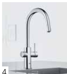
GROHE BLUE MD EAU FRAÎCHE ET GAZEUSE 2.0