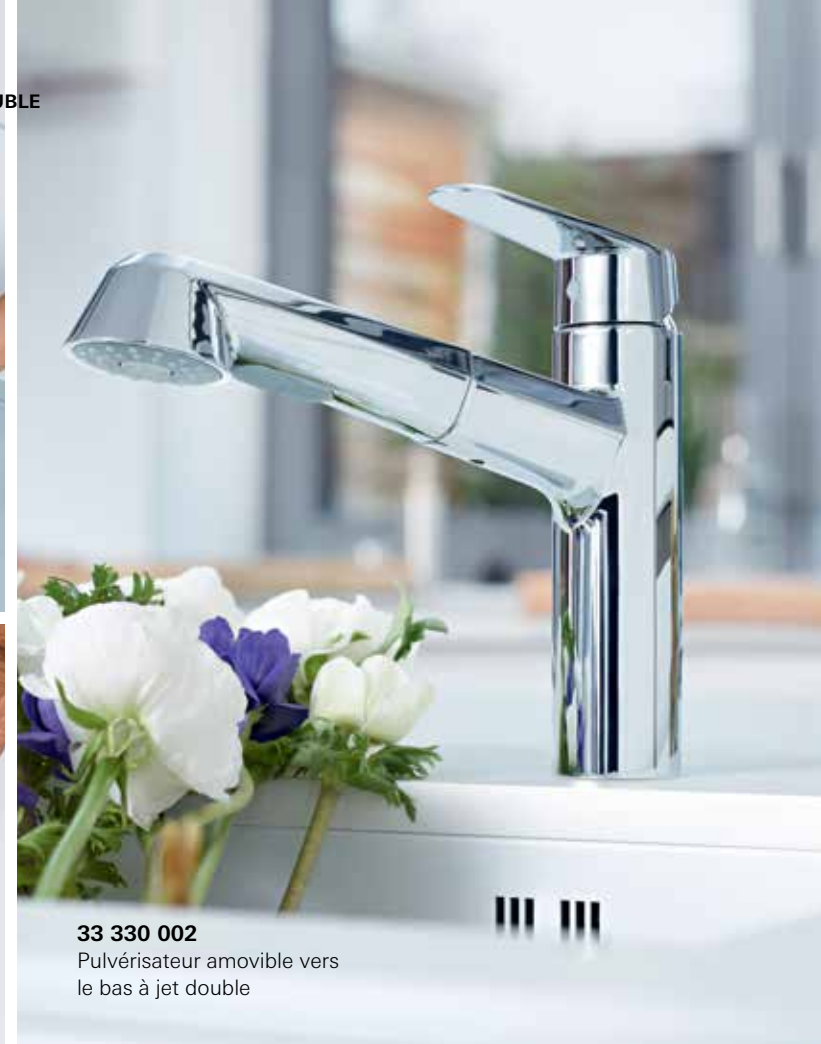
33 330 002 Pulvérisateur amovible vers le bas à jet double