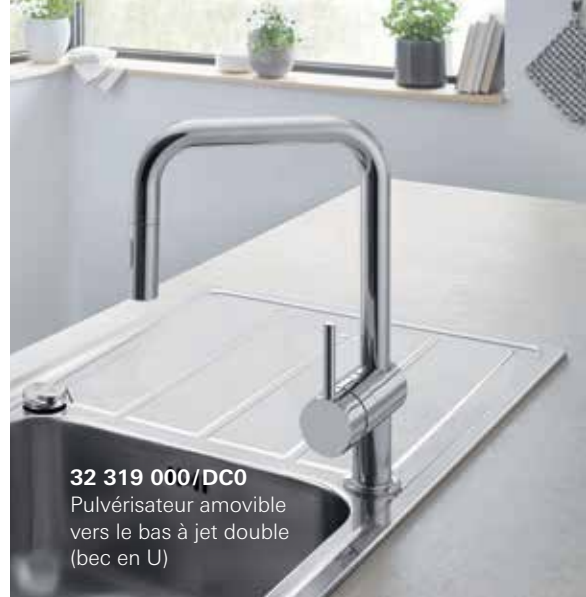
32 319 000/DC0 Pulvérisateur amovible vers le bas à jet double (bec en U)