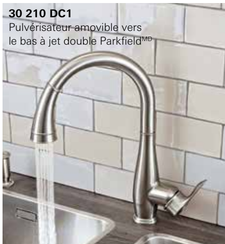
30 210 DC1 Pulvérisateur amovible vers le bas à jet double Parkfield MD