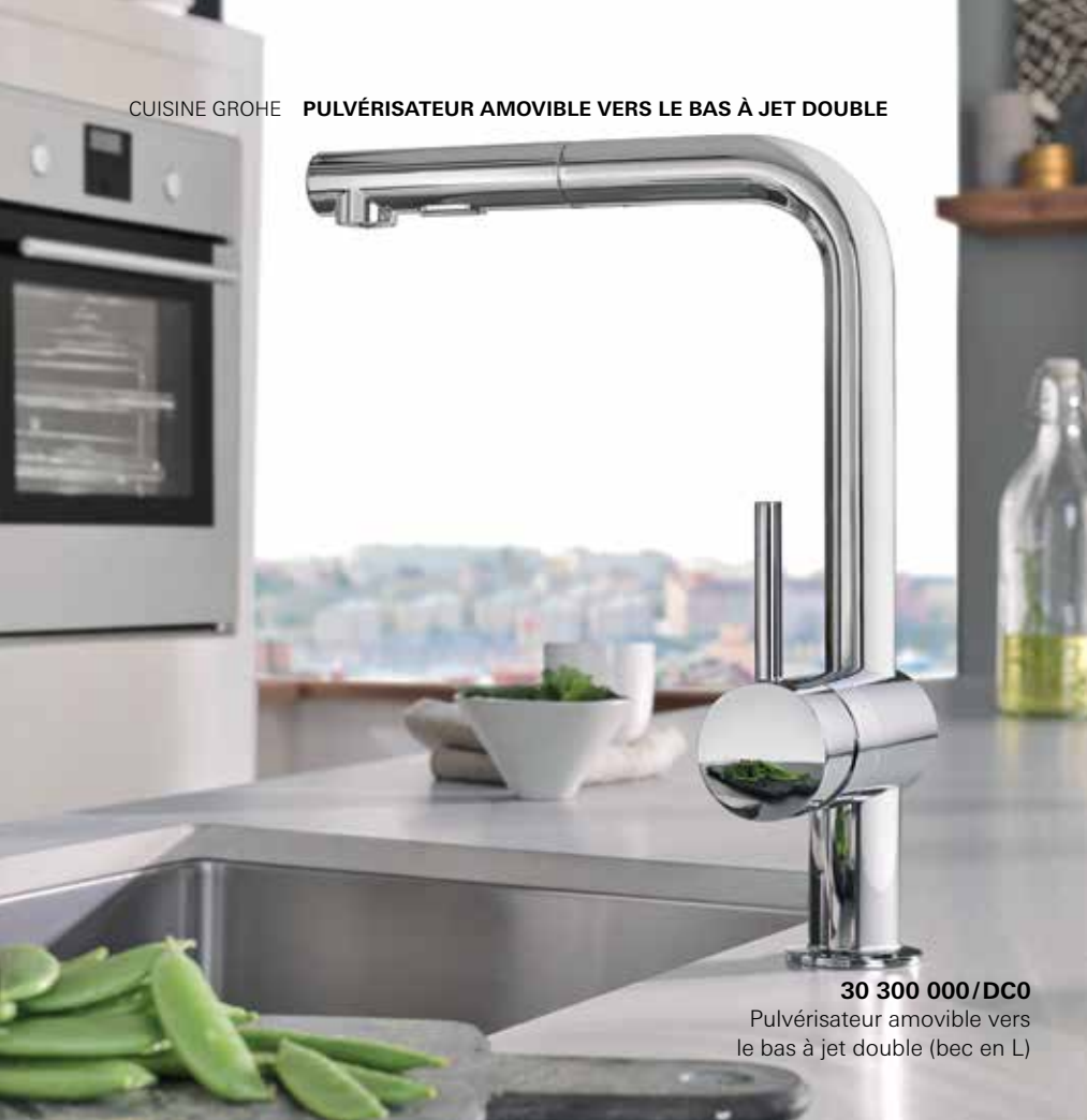
30 300 000/DC0 Pulvérisateur amovible vers le bas à jet double (bec en L)