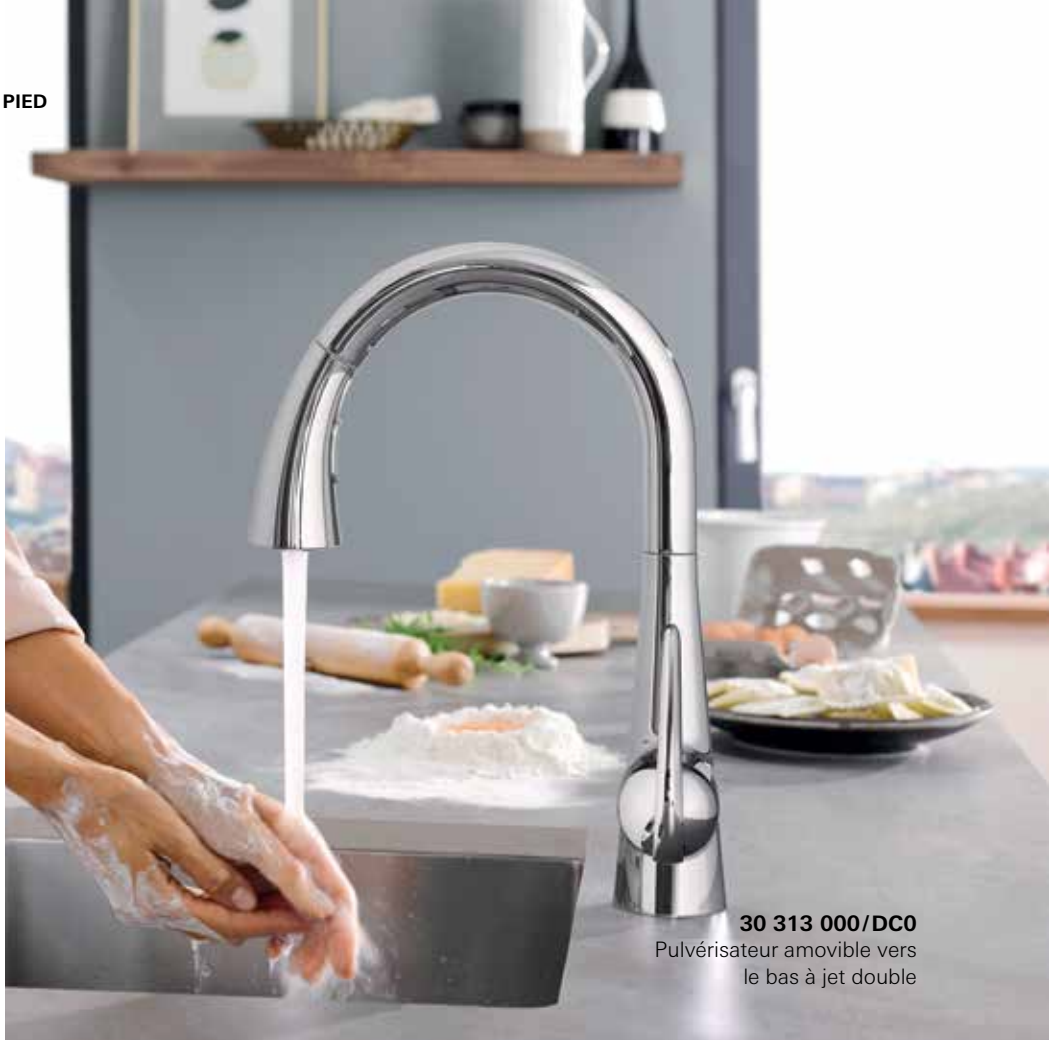
30 313 000/DC0 Pulvérisateur amovible vers le bas à jet double