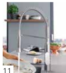
GROHE K7 MD COMMANDÉ AU PIED