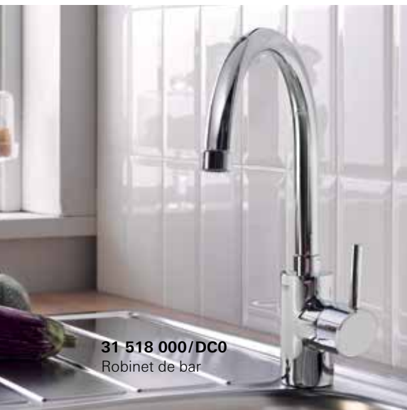
31 518 000/DC0 Robinet de bar