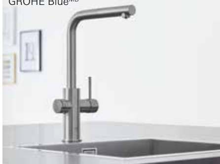
31 608 DC2 GROHE Blue MD