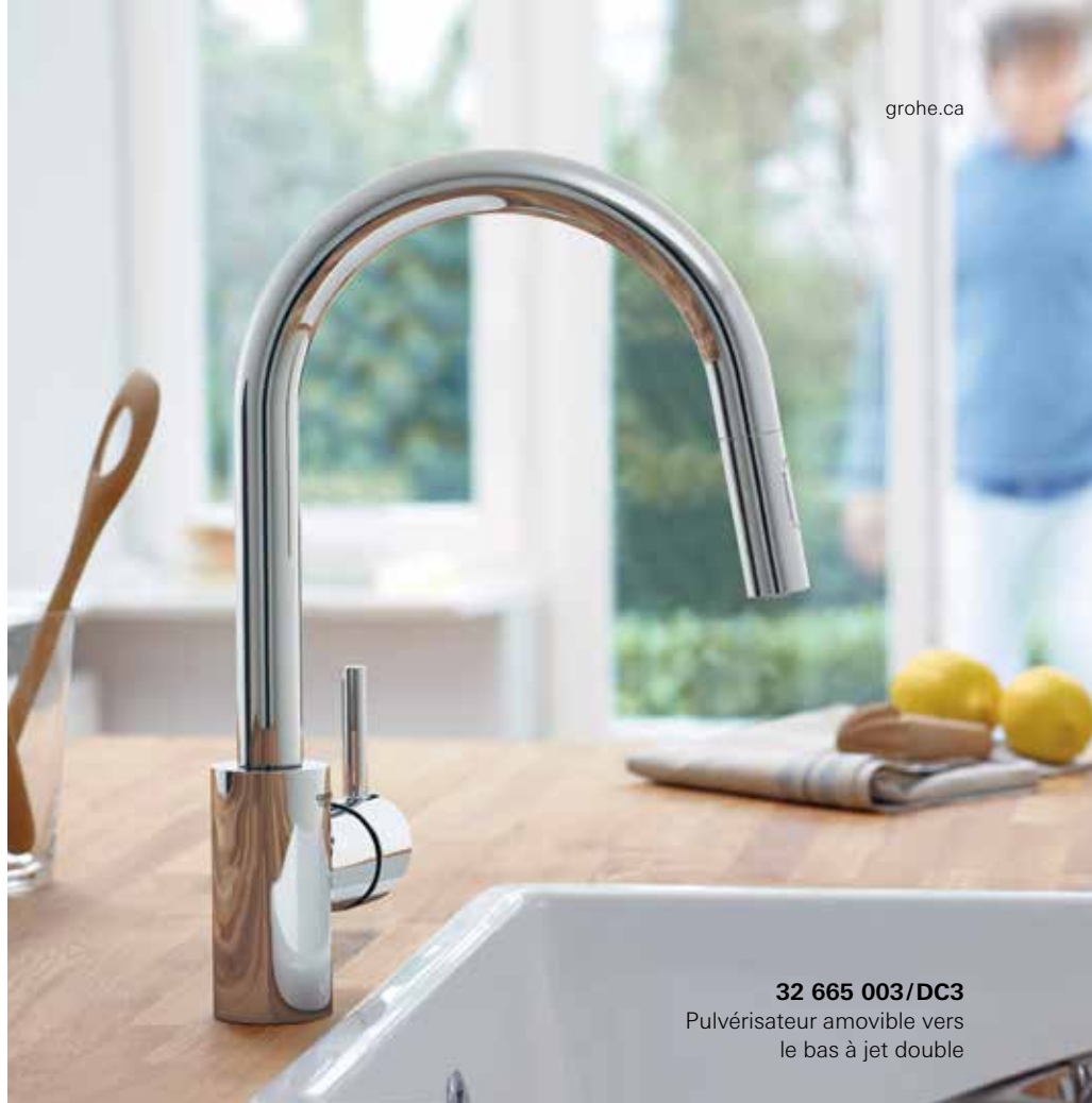
32 665 003/DC3 Pulvérisateur amovible vers le bas à jet double