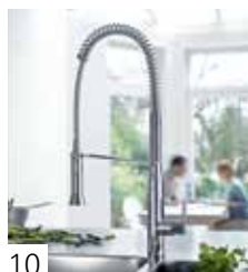
GROHE K7 MD