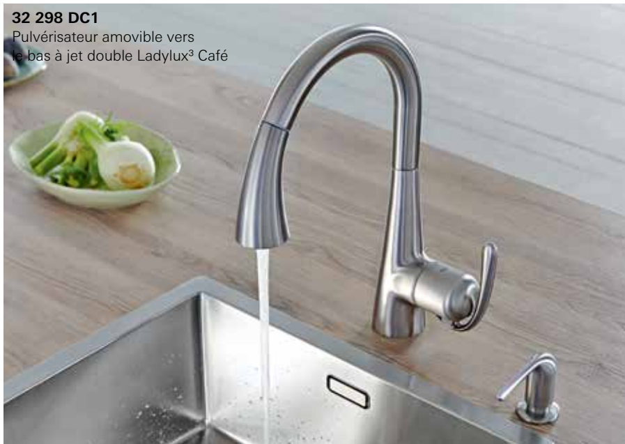
32 298 DC1 Pulvérisateur amovible vers le bas à jet double Ladylux 3 Café